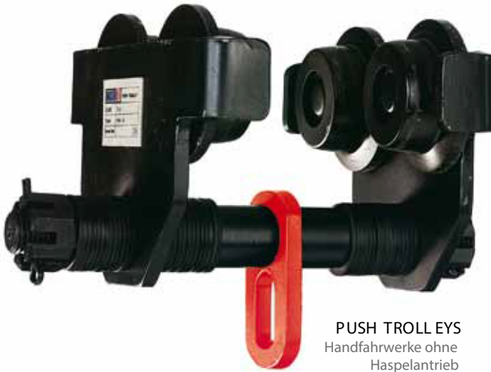
PUSH TROLLEYS Handfahrwerke ohne Haspelantrieb