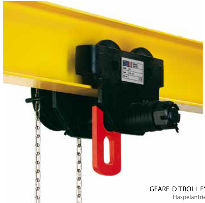
GEARED TROLLEYS Haspelantrieb